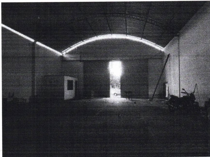
Vista interna da Recepção, ao fundo Sala/Escritório em reforma.