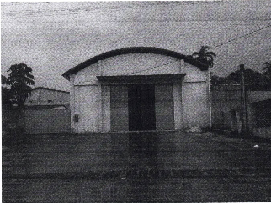
Vista frontal da edificação.