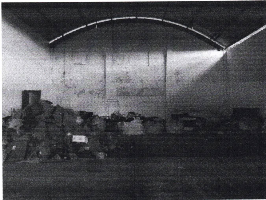
Vista interna do depósito, aos fundos a esquerda vista do banheiro em reforma.