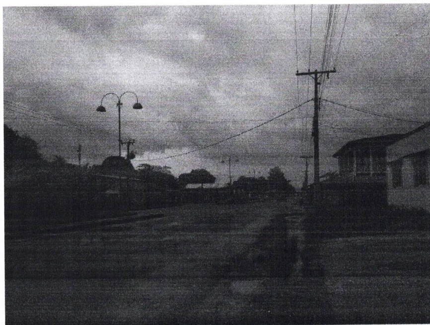
Vista longitudinal da Avenida João Pessoa – PA-424, sentido Centro da cidade.