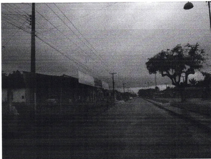
Vista longitudinal da Avenida João Pessoa – PA-424, sentido BR-316.