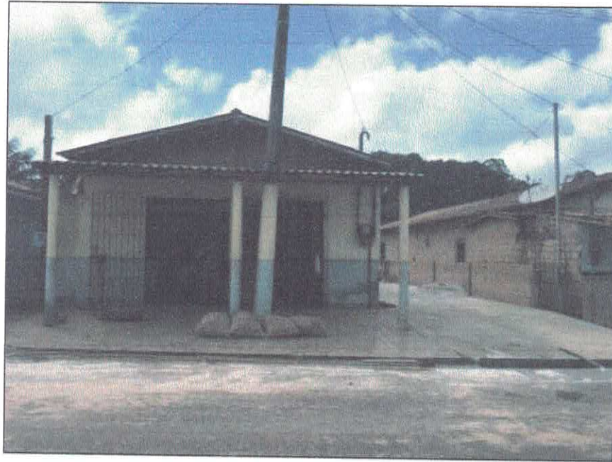
Vista frontal da edificação.