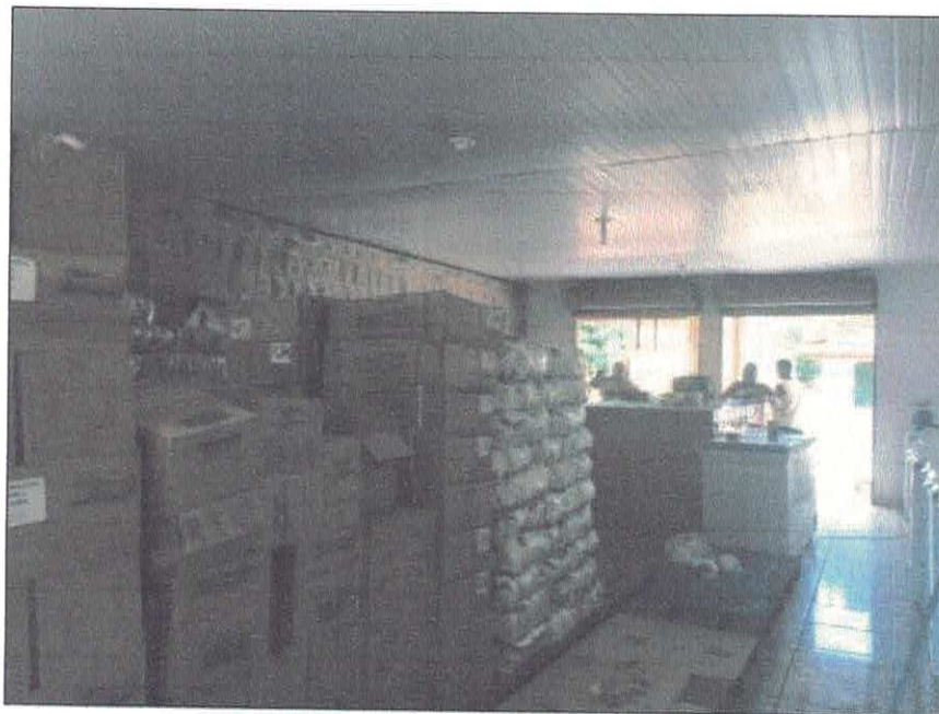
Vista interna depósito.