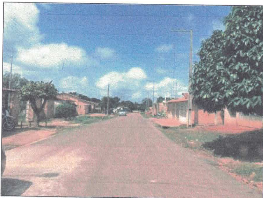
Vista longitudinal da Rua Germano Melo, sentido Avenida João Pessoa.