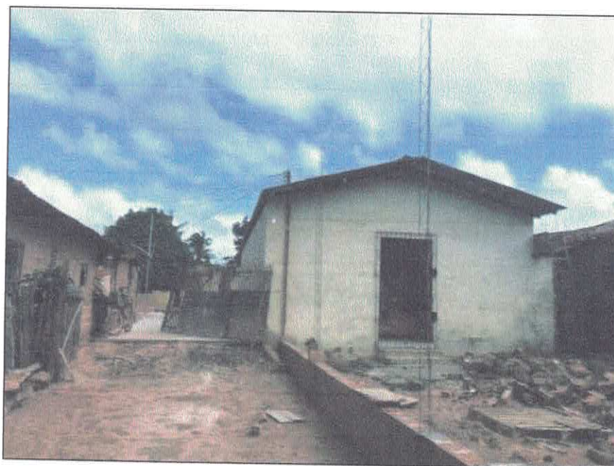
Vista externa fachada posterior.