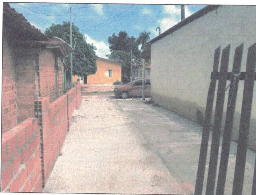
Vista externa entrada de veículos para armazenamento e saída da merenda escolar.