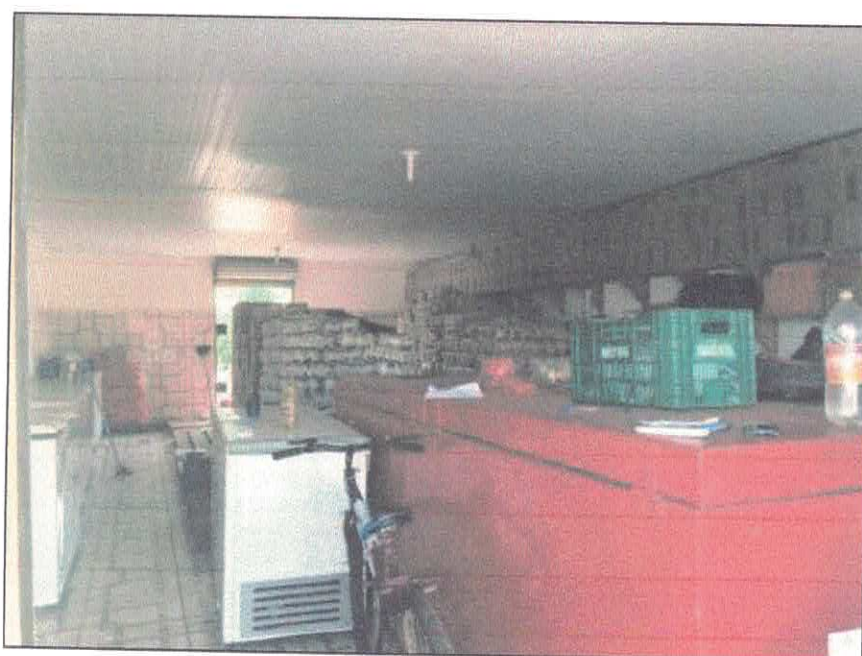
Vista interna depósito.