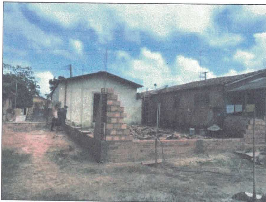
Vista externa ampliação do depósito.