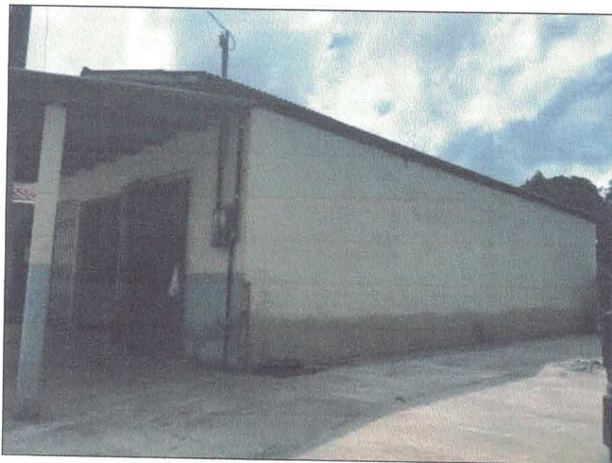
Vista lateral da edificação.