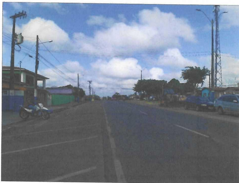
Vista longitudinal da Avenida Barão do Rio Branco – PA-320, sentido Município de São Francisco.