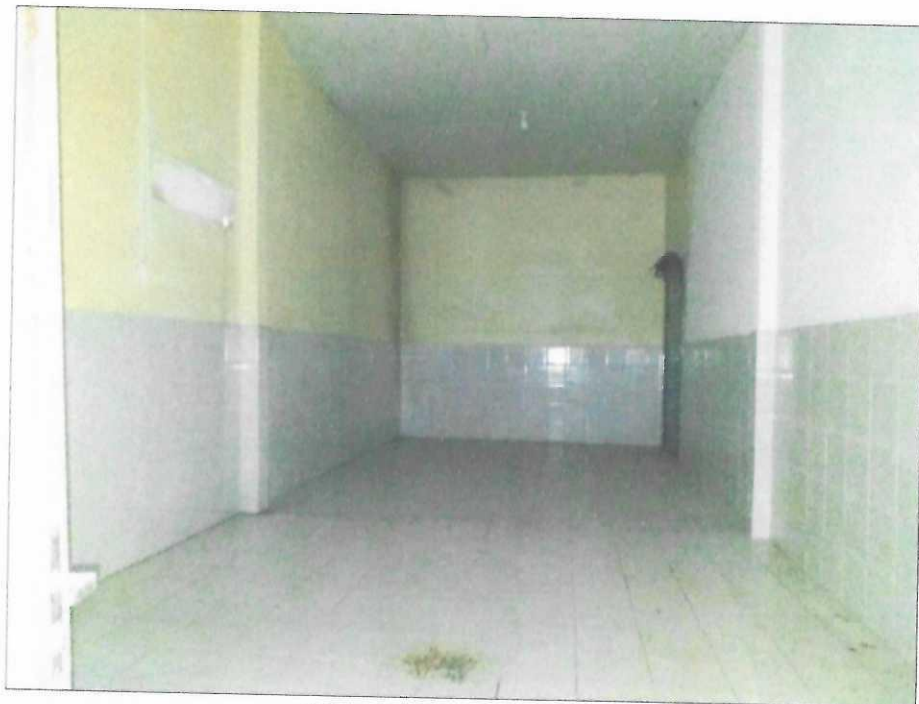
Vista interna do depósito 02.