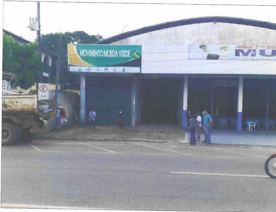
Vista frontal da edificação.