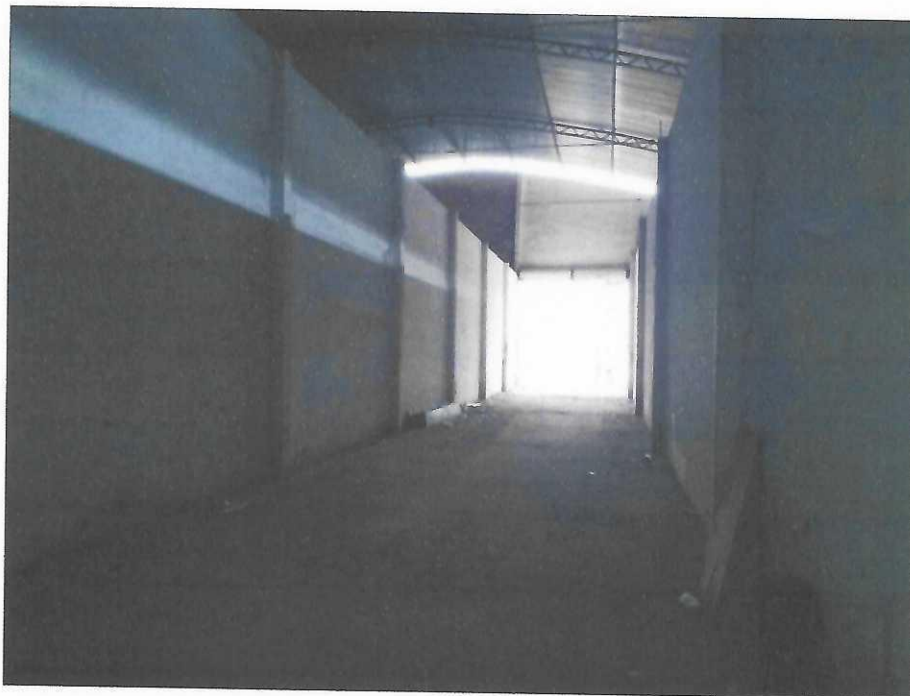
Vista interna do depósito 01, entrada da edificação.