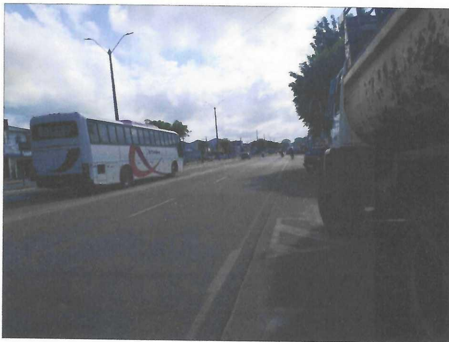
Vista longitudinal da Avenida Barão do Rio Branco – PA-320, sentido centro da cidade.