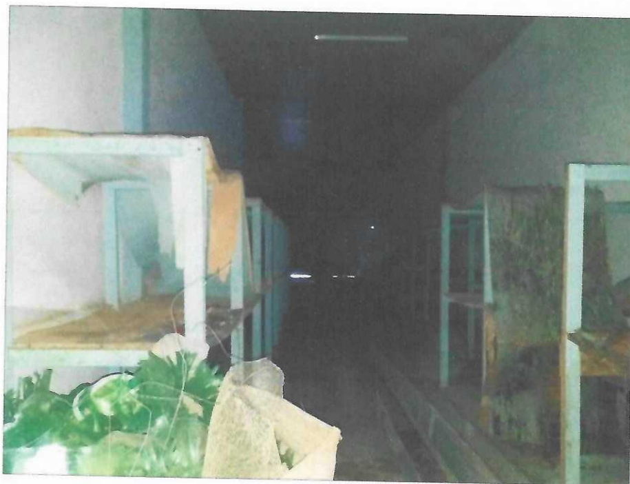
Vista interna do depósito 02, entrada da edificação.