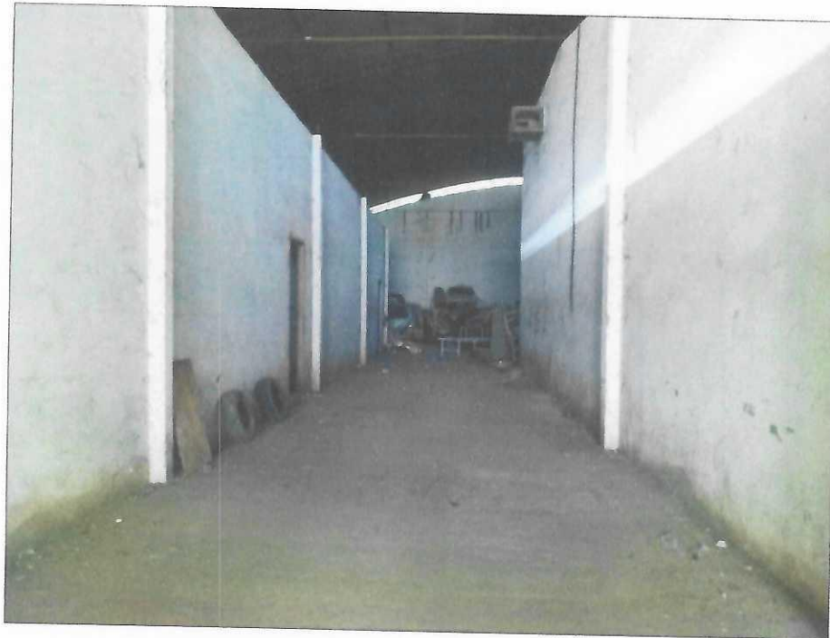
Vista interna do depósito 01, entrada da edificação.