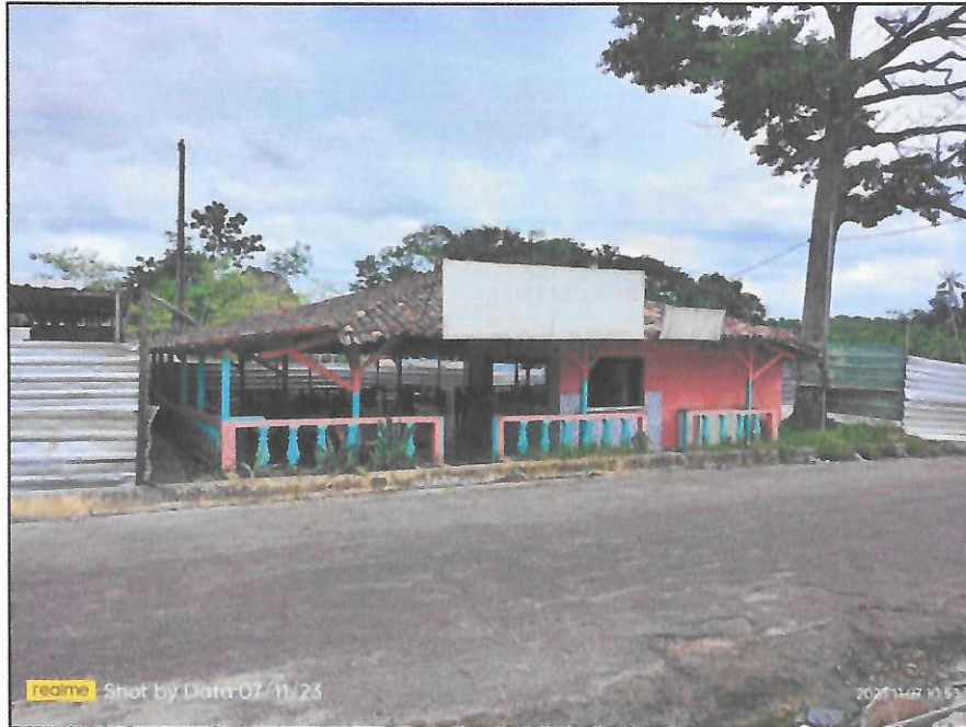
Imagem 01: Imóvel ocupado dentro da área de execução do projeto de revitalização do balneário Pau Cheiroso. Igarapé-Açu/PA, 07 de novembro de 2023

Colocando-nos ao seu dispor para eventuais esclarecimentos, subscrevo-nos,